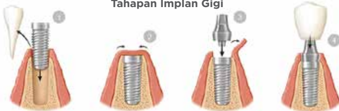
Tahapan Implan Gigi